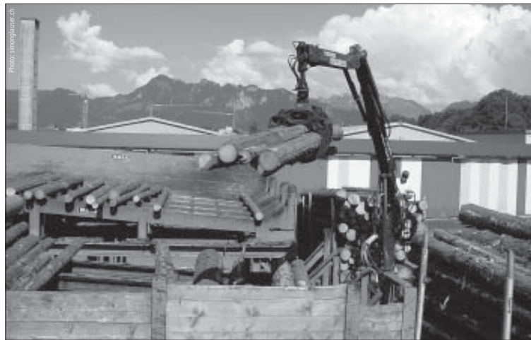
► Die Teilnehmer des diesjährigen Fraktionsausflug kamen in den Genuss einer interessanten Führung im Holzverarbeitungsbetrieb von Nationalrat Jean-François Rime, Bulle (FR)

Anders gesagt: Die Landeswerbung splittet sich auf in die Promotion der Wirtschaftszusammenarbeit (OSEC), Imagewerbung (Präsenz Schweiz), kulturelle Aktivitäten (Pro Helvetia u.a.) und Tourismuswerbung (Schweiz