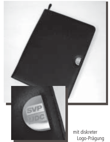
mit diskreter Logo-Prägung