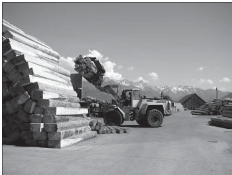
► Stolz Zahl: Jährlich werden in Bulle 150'000 m 3 Holz verarbeitet