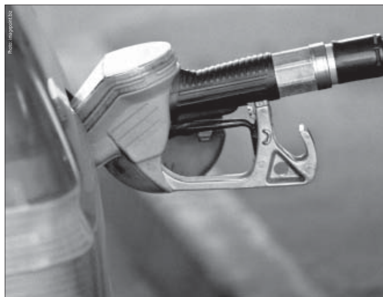
► CO 2 -Abgabe: 30 Rappen pro Liter - Nein, danke!

Das kann natürlich nicht der Sinn der Übung sein. Die freiwilligen Massnahmen zur Zielerreichung, sowohl im Brennstoff- wie auch im Treibstoffbereich, sollen dazu führen, dass auf eine CO 2 -Abgabe verzichtet werden kann.