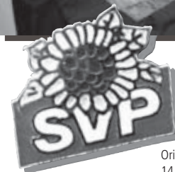
Originalgrösse 14 x 12 mm