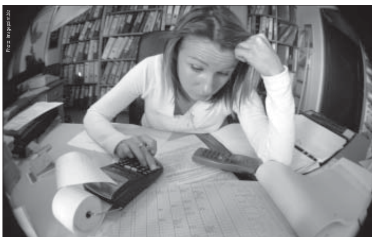
► Weniger Kopfzerbrechen beim Steuern zahlen dank dem Steuersenkungspaket!

Ein JA zum Steuersenkungspaket ist ein mutiger Schritt für eine bessere Zukunft, in der wieder belohnt wird, wer sich für sich und seine nächste Umgebung, seine Familie einsetzt. Dies kommt der ganzen Gesellschaft zugute. ◀