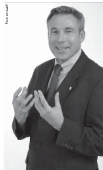
► Nationalrat Adrian Amstutz, Sigriswil (BE) www.adrian-amstutz.ch

Der Vollzug von Wettbewerbsgesetzen soll echte Wettbewerbsprobleme lösen und muss deshalb möglichst unabhängig von der Tagespolitik sein. Während aber selbst die als „unabhängig“ konzipierte Wettbewerbskommission politischen Einflüssen nicht völlig entzogen sein dürfte, ist der Posten des „Monsieur Prix“ geradezu als politische Schalt-