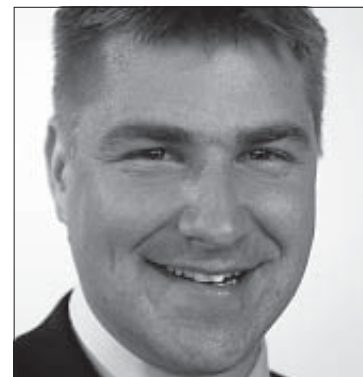
► Nationalrat Toni Brunner, Ebnat-Kappel (SG)

In Art. 104 (Landwirtschaft) der Bundesverfassung wird statuiert, dass der Bund dafür zu sorgen hat, dass die Landwirtschaft einen wesentlichen