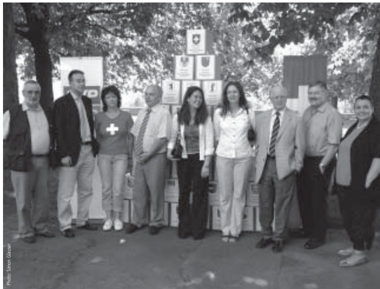
► Zufriedene Gesichter bei der Einreichung des Referendums gegen die Kohäsionsmilliarde - über 70'000 Unterschriften wurden gesammelt!

(SVP) Das Referendum gegen das Bundesgesetz über die Zusammenarbeit mit den Staaten Osteuropas (Osthilfegesetz) ist zustande gekommen. Damit wird das Volk entscheiden können, ob trotz wachsenden Schuldenbergen zusätzliche Milliardenzahlungen an die EU entrichtet werden sollen und dafür ein Gesetz geschaffen wird, das auch künftige Zahlungen ohne demokratisches Mitspracherecht möglich macht.