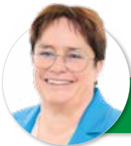
Von Magdalena Martullo-Blocher, Nationalrätin, Lenzerheide (GR) und Meilen (ZH)

Mit den Verträgen übernehmen wir auf einen Schlag über 20'000 Seiten EU-Regelungen. Jedes Jahr erlässt die EU 150'000 neue Seiten. Alles, was die Zuwanderung, den Strom oder die Lebensmittel betrifft, gilt dann direkt und unmittelbar für alle und jedermann in der Schweiz! Auch neue Regelungen, die die Schweiz speziell verpflichten. Sogar wenn wir ausdrücklich etwas anderes beschliessen, urteilen die Gerichte trotzdem nach der EU-Regelung!