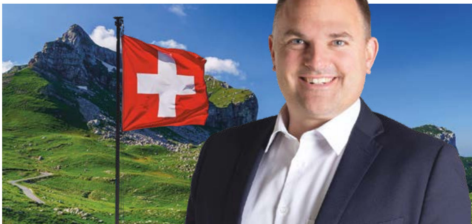
Marcel Dettling Nationalrat und Präsident der SVP Schweiz

Wir dürfen uns nicht erpressen lassen. Die richtige Antwort ist: Wir müssen unsere Hausaufgaben in der Schweiz machen. Besser sein als die EU: Weniger Bürokratie und Steuern für die Unternehmen und für uns alle. Dazu gehört auch die Abschaffung des Eigenmietwerts, der Wohneigentum bestraft statt fördert.