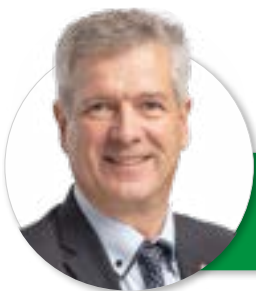
Von Thomas de Courten, Nationalrat, Rünenberg (BL)

Mit dem EU-Unterwerfungsvertrag will uns der Bundesrat einen «gemeinsamen Lebensmittelraum» aufschwätzen. Betroffen wären vom Hofladen bis zur Festwirtschaft an einem Schwingfest alle. Im Klartext: Brüssel bestimmt, was bei der Schweizer Bevölkerung auf den Teller kommt.