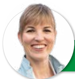
Von Diana Gutjahr, Nationalrätin, Amriswil (TG)

Die Juso-Enteignungsinitiative ist ein ideologischer Frontalangriff auf die Schweizer Wirtschaft, den Mittelstand und die unternehmerische Freiheit. Unter dem Deckmantel von Klimaschutz und Gerechtigkeit wollen die Jungsozialisten nichts weniger als die Abschaffung des Kapitalismus und die Einführung eines Öko-Sozialismus – DDR 2.0 lässt grüssen.