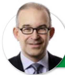
Von Gregor Rutz, Nationalrat und Präsident HEV Schweiz, Zollikon (ZH)

Die «Eigenmietwert»-Steuer wurde 1933 per Notrecht als eidgenössische Krisenabgabe eingeführt. Seither müssen Wohneigentümer diese Sondersteuer bezahlen. Berechnet wird sie auf einem fiktiven Mieteinkommen, das gar nicht existiert. Dies belastet Rentner und erschwert gleichzeitig für junge Familien den Erwerb einer Wohnung oder eines Hauses. Höchste Zeit, diese absurde Steuer zu streichen.