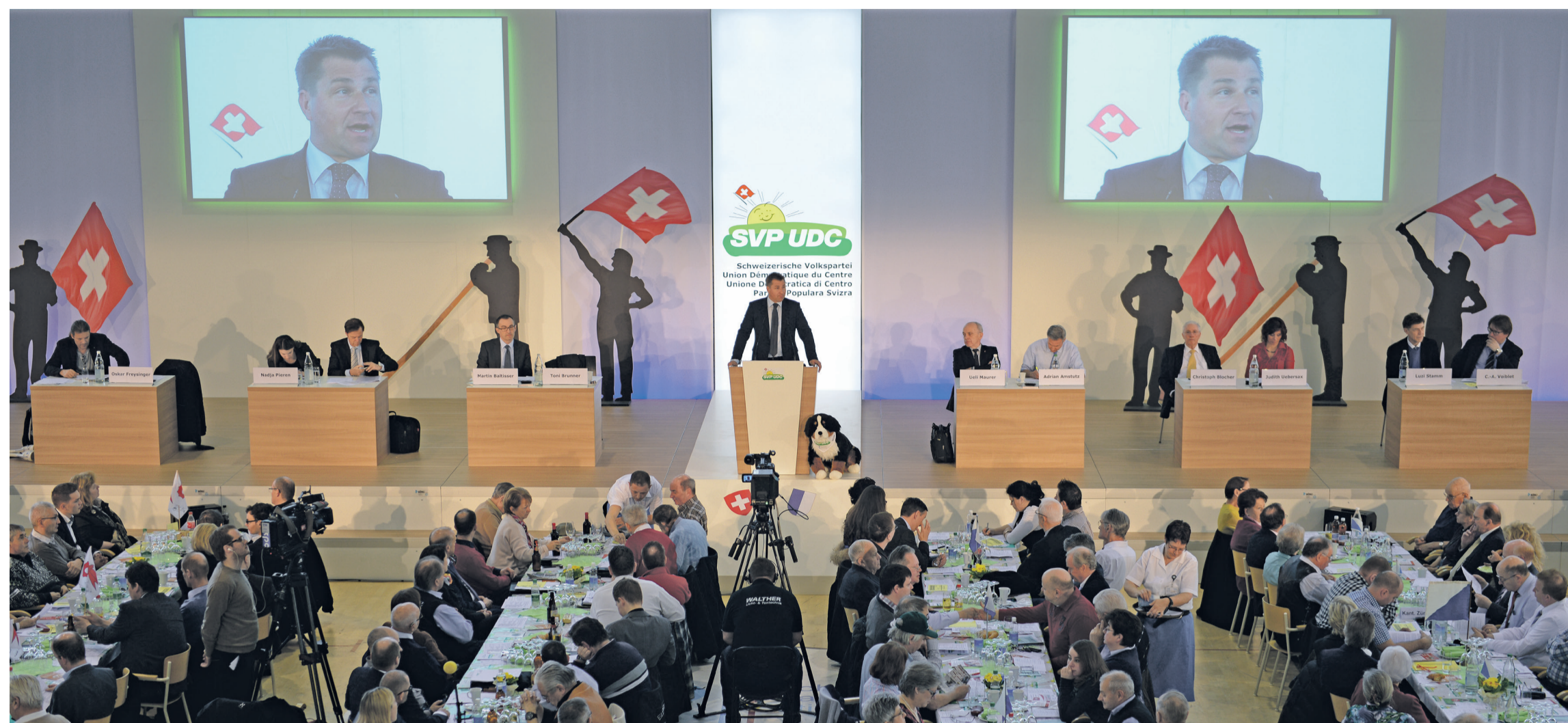
Die Parteimitglieder bestimmen! Mit rund 750 Delegierten sind die Delegiertenversammlungen der SVP die grössten politischen Veranstaltungen im Lande. Hier am 28. Februar 2015 in Notwil (LU).